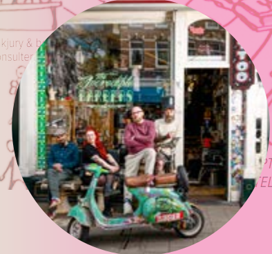
vakjury & b consultatie